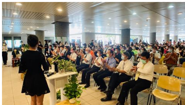
▲募款聯誼餐會，廣邀校友們返校參與