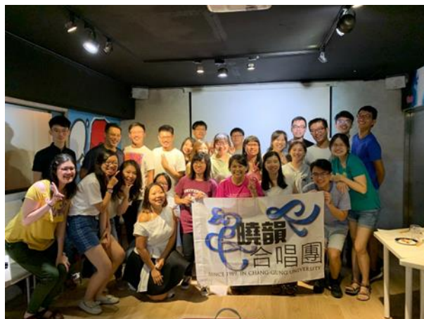
▲校友團成立會後合影留念