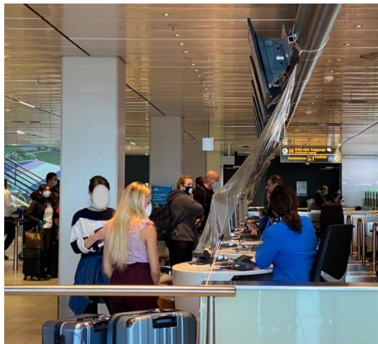
▲機場報到大廳，有嚴密的防疫措施。