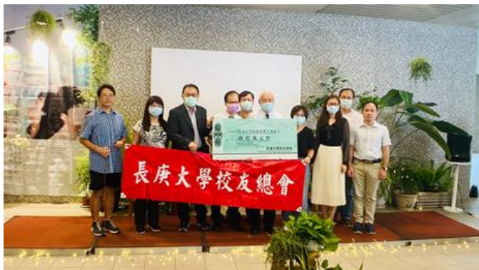
▲長庚大學校友總會捐出 50 萬元拋磚引玉，扶助弱勢助學

長庚大學近年持續推動扶助弱勢募款，依捐款金額不同將贈送包括明信片、帆布袋、小書包，以及依學校第一醫學大樓、學生活動中心所打造的微型積木等紀念品，聯誼會活動現場更特別加碼，額外捐款者還能獲贈限量且限定的禮品，期待透過捐款者溫暖的手，翻轉弱勢學子的未來。