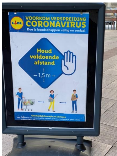
▲當地提醒保持社交距離的告示牌。